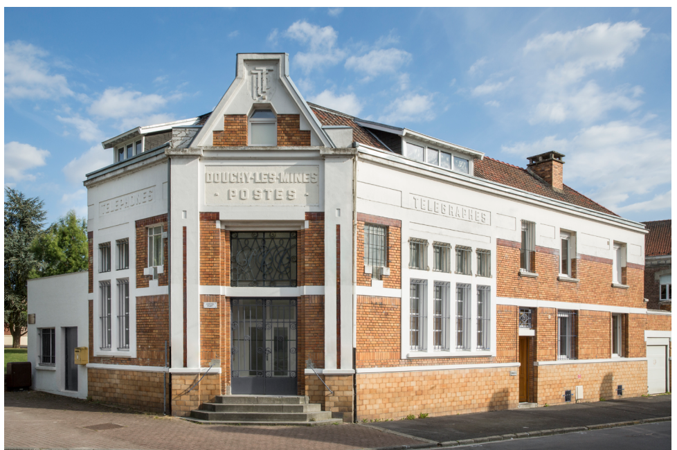
Façade du CRP/ © Vincent Everarts.

L'artothèque du CRP/ quant à elle, propose plus de 500 œuvres photographiques originales, disponibles au prêt et accessible à tous (particuliers, entreprises, collectivités...).