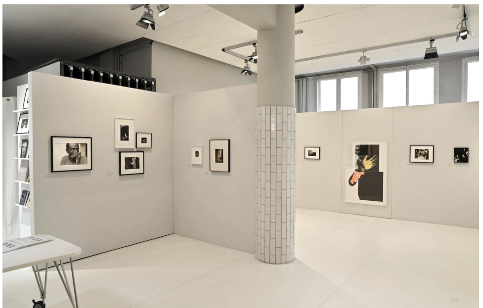
Vue de l'exposition «L'éloge de la main», exposition collective, 2021. Les Douches la Galerie, Paris.

Membre de l'AIPAD (Association of International Photography Art Dealers), Les Douches la Galerie participe à des foires internationales telles que Paris Photo, Art Cologne et l'AIPAD Photography Show New York.