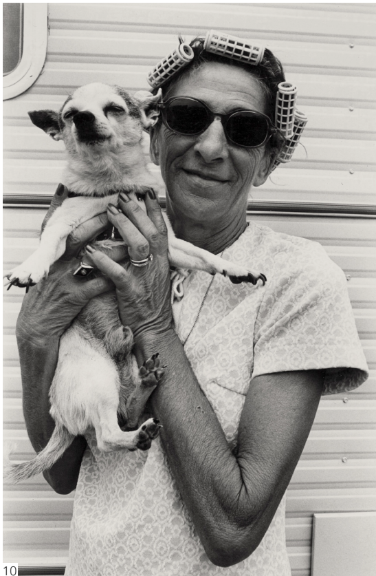
10. Arlene Gottfried - Wife with Chihua- hua, 1980.