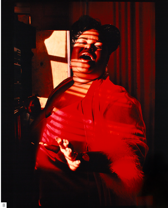
8. Arlene Gottfried - Untitled, n.d.