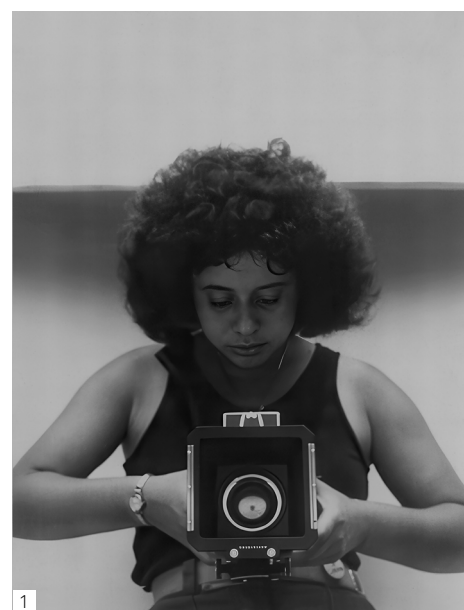
1 Arlene Gottfried - Arlene Self Portrait, 1977 / © Estate Arlene Gottfried / Courtesy Les Douches la Galerie, Paris.

L'exposition Picture Stories : Photographs by Arlene Gottfried présentera une trentaine d'œuvres issues de cette donation à partir du 31 janvier 2025 au The New York Historical, à New York (USA).