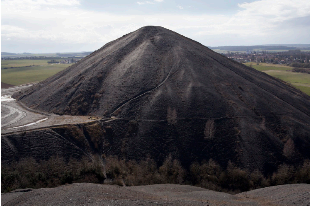
“Shadow - terrills and mining landscapes”, Terril 2 Haillicourt, 2014, Collection du CRP/, © John Davies