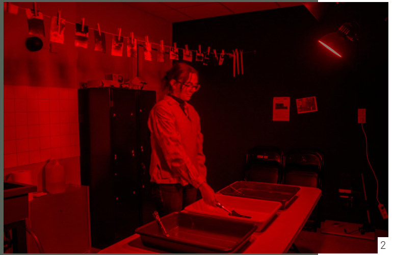
4/ Atelier nature morte en écho à l'exposition Robin Lopvet «Mytho»