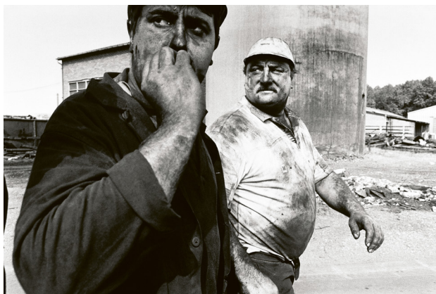
Opposite: Châtalet, from the series Abbas , 2012 © Bruce Gilman. From the Collection of CRP/.