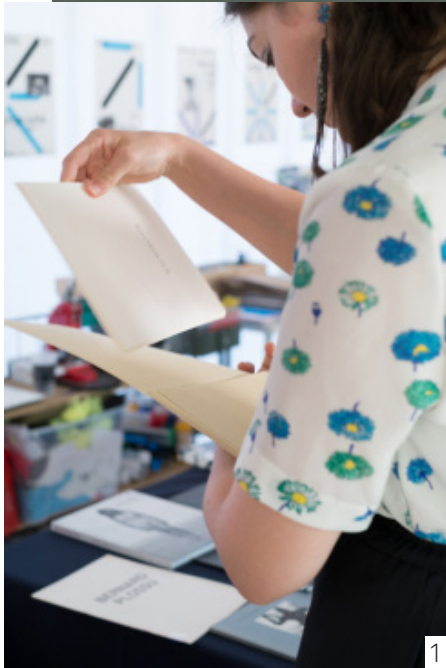
1/ Braderie de livres photo © Ermis Papastamou