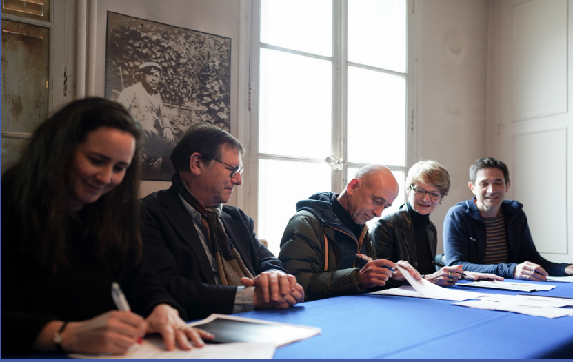
Lancement du Cercle Hippolyte Bayard à Breteuil (Oise)